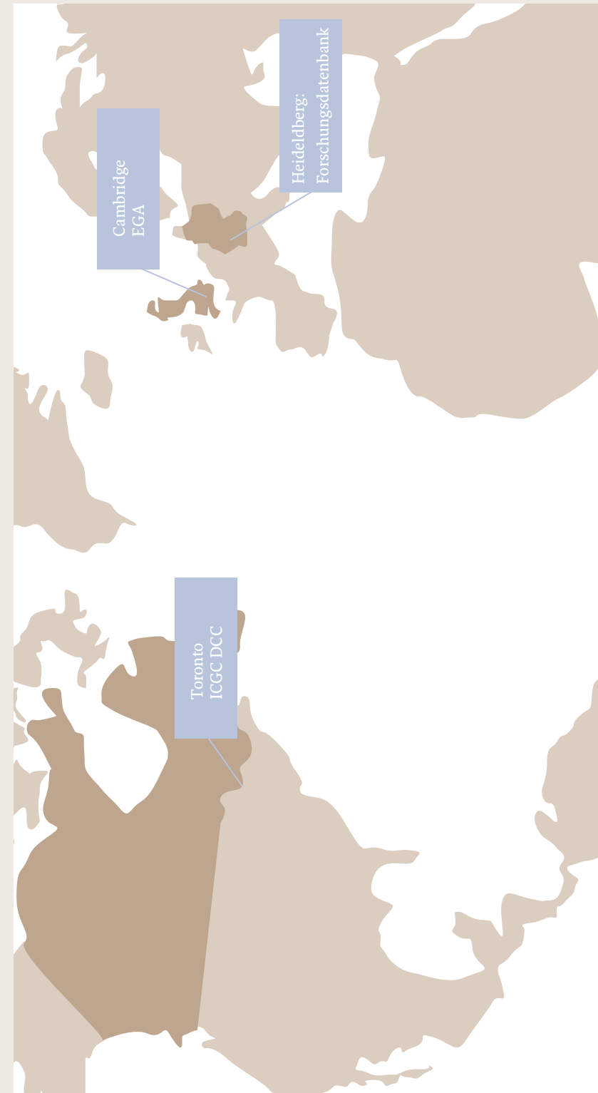
Beispiel für einen internationalen Datenaustausch: Heidelberg im International Cancer Genome Consortium (ICGC)